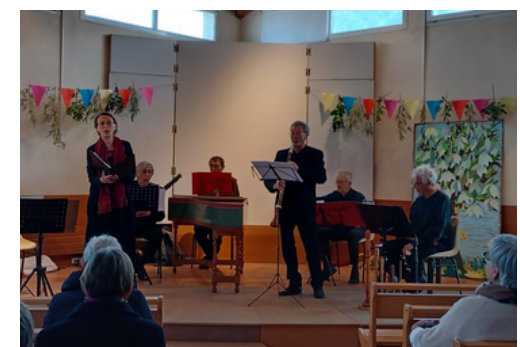
Le concert des Passereaux