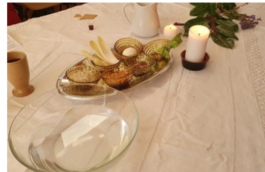
Célébration du Jeudi Saint : le repas Pascal

Merci Jésus pour Ton soutien, Vers Toi nous joignons nos mains, Et prions avec entrain, En te disant : Seigneur Viens