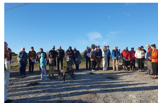
Matin de Pâques au Pas de Bousnières